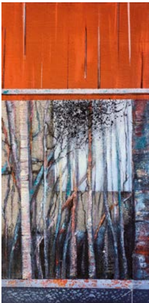
Sous bois Acrylique et fusain 40 x 20 cm (2019)