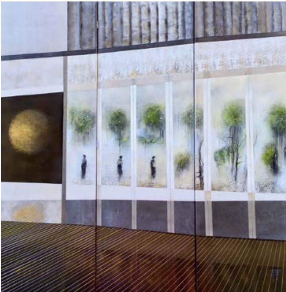
Les éphémères Huile et acrylique 150 x 150 cm (2019)