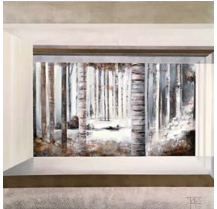
Dans la forêt profonde Huile et acrylique 80 x 80 cm (2018)