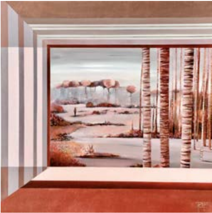
Rougeoiements Huile et acrylique 100 x 100 cm (2018)