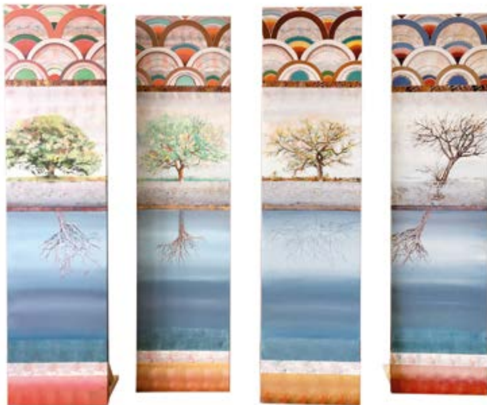
Les 4 saisons Huile et acrylique 180 x 160 cm (2019)