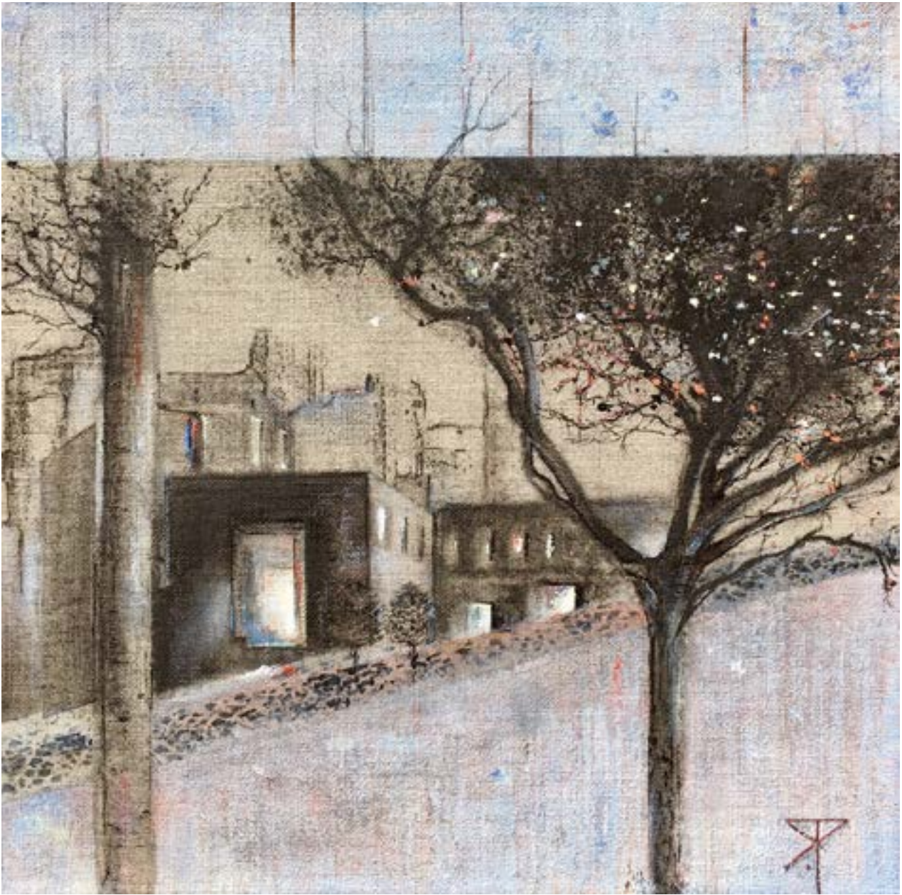
Lueurs Acrylique et fusain 30 x 30 cm (2020)