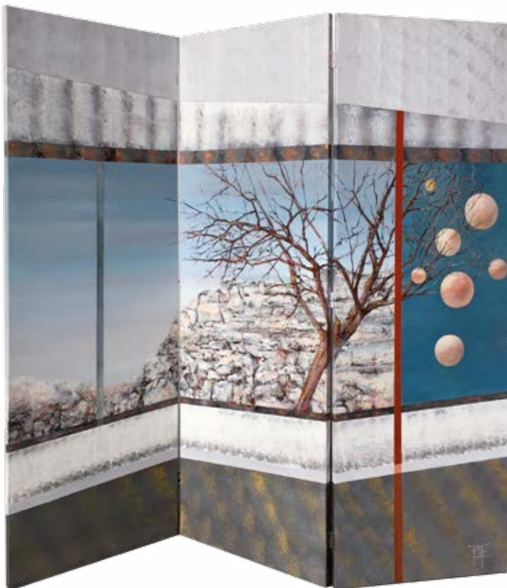
Panorama (en paravent)