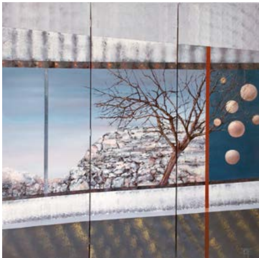
Panorama Huile et acrylique 150 x 150 cm (2019)

Les paysages, les petites collines faites de graviers ou de grosses pierres émergent des brumes de l'inconscient.