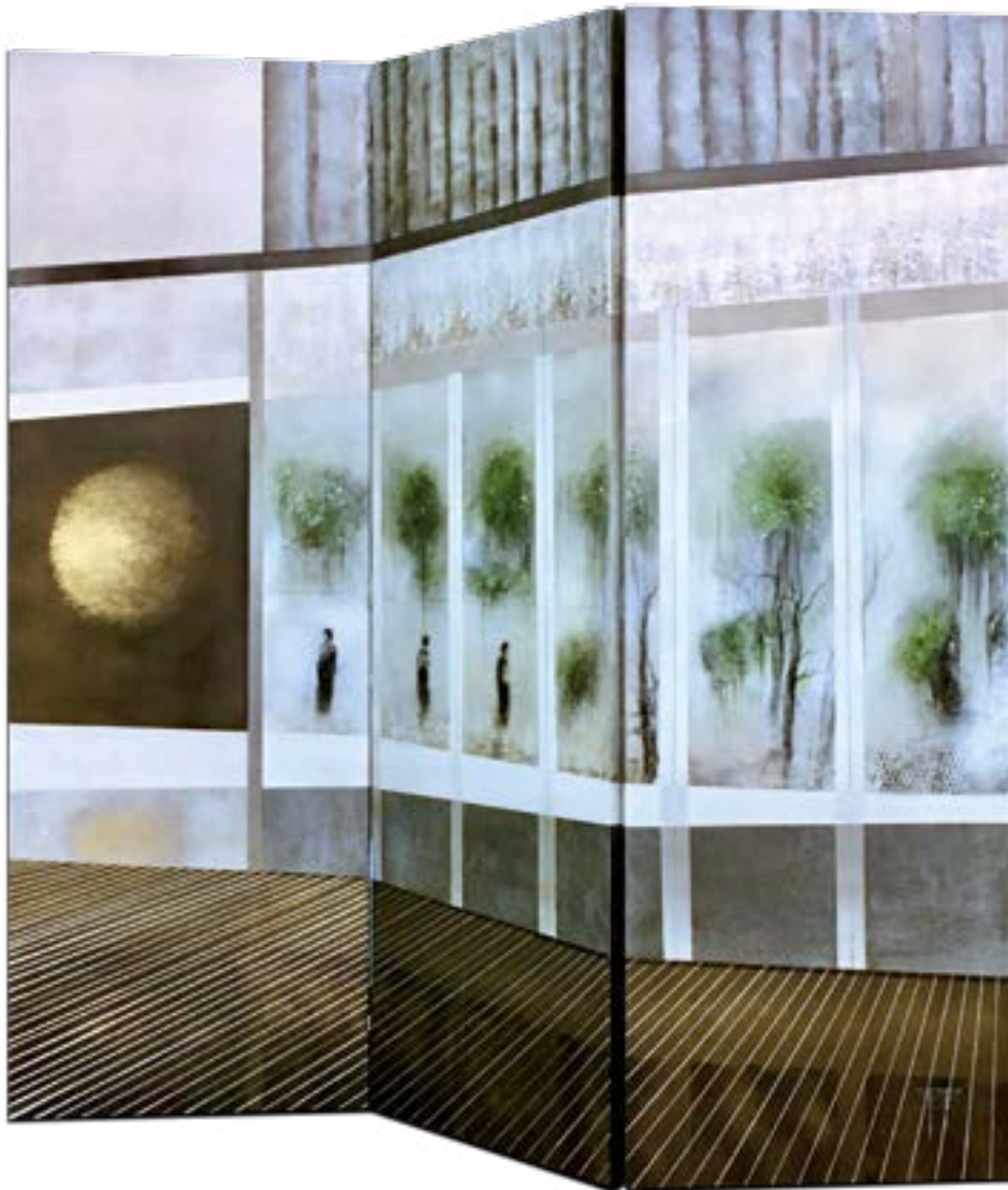
Les éphémères (en paravent)