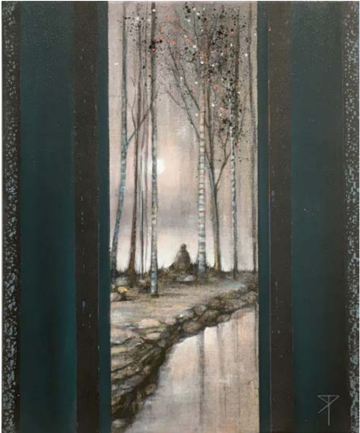
Près du lac Acrylique et fusain 38 x 24 cm (2020)