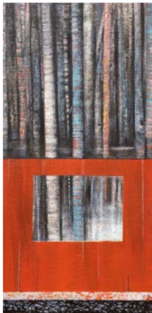
Sous bois 1 Acrylique et fusain 40 x 20 cm (2019)