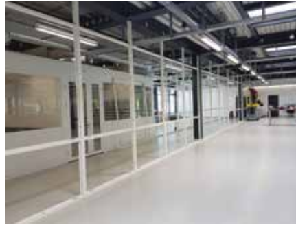
Montage et fixation des cadres