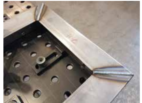
Soudage au Mig