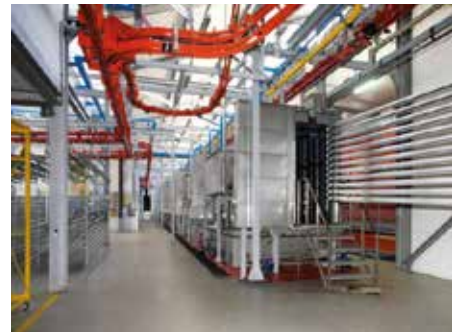
Thermopoudrage automatisé chez notre partenaire