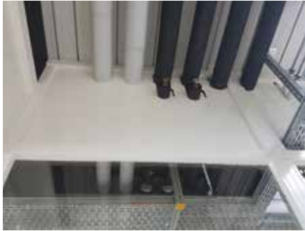
Intégration des finitions à l'existant