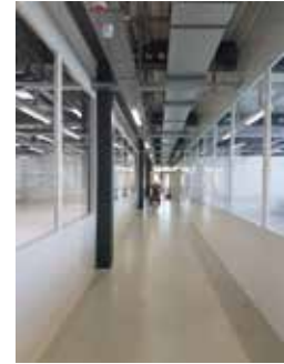
Pose du vitrage et des panneaux