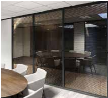
Cloison avec store intégré