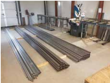
Réception des profilés et débitage