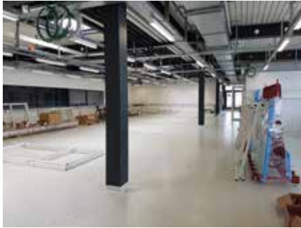
Réception et préparation du chantier