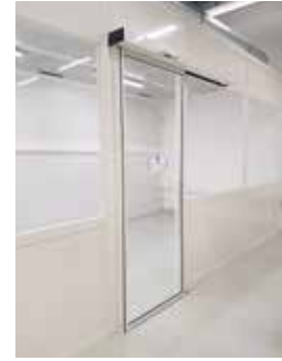
Intégration de porte automatique