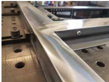
Finition des éléments