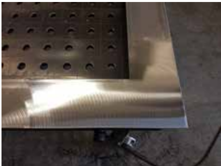
Nettoyage et polissage des soudures