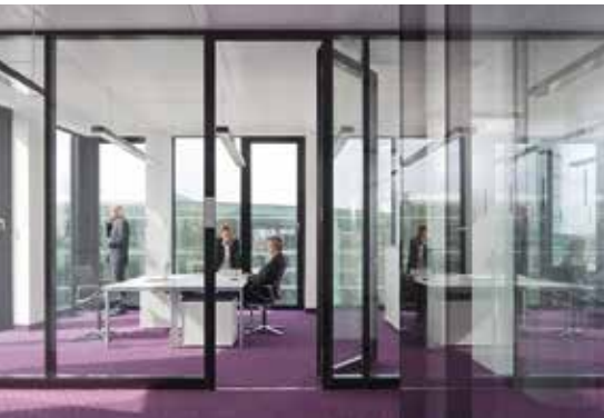
Cloison de bureaux