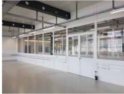
Intégration de conduites techniques